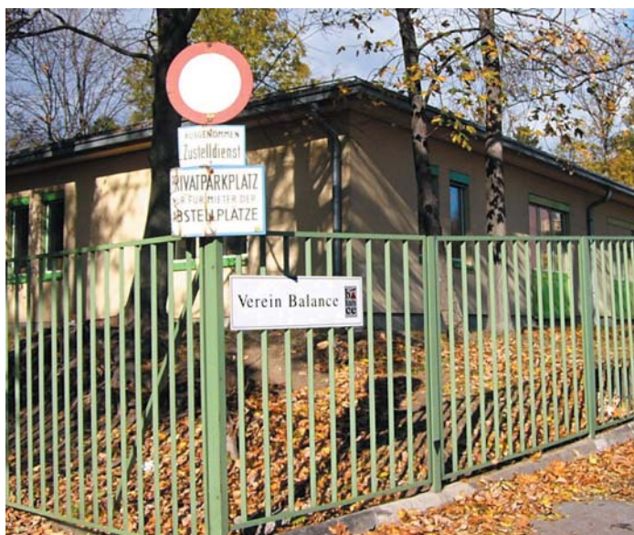
Flachbau an der Stranzenberggasse: Bald mehrstöckiger Bau mit Großgarage darunter?

Nun ist es halt logisch, dass eine Firma, die ein Grundstück (vielleicht günstig, wenn es noch nicht umgewidmet ist) erworben hat, auch ihren Gewinn daraus ziehen möchte. Der "Sündenfall" begann früher: Ein Ex-Minister, der erst jüngst wegen eines Skandals um eine 10 Millionen Euro-Provision an zwei seiner Freunde im Zuge des Verkaufs von Bundeswohnungen in den Schlagzeilen war, hat seinerzeit auch einen großen Teil des Invalidenhausparks privatisiert (zu den Details